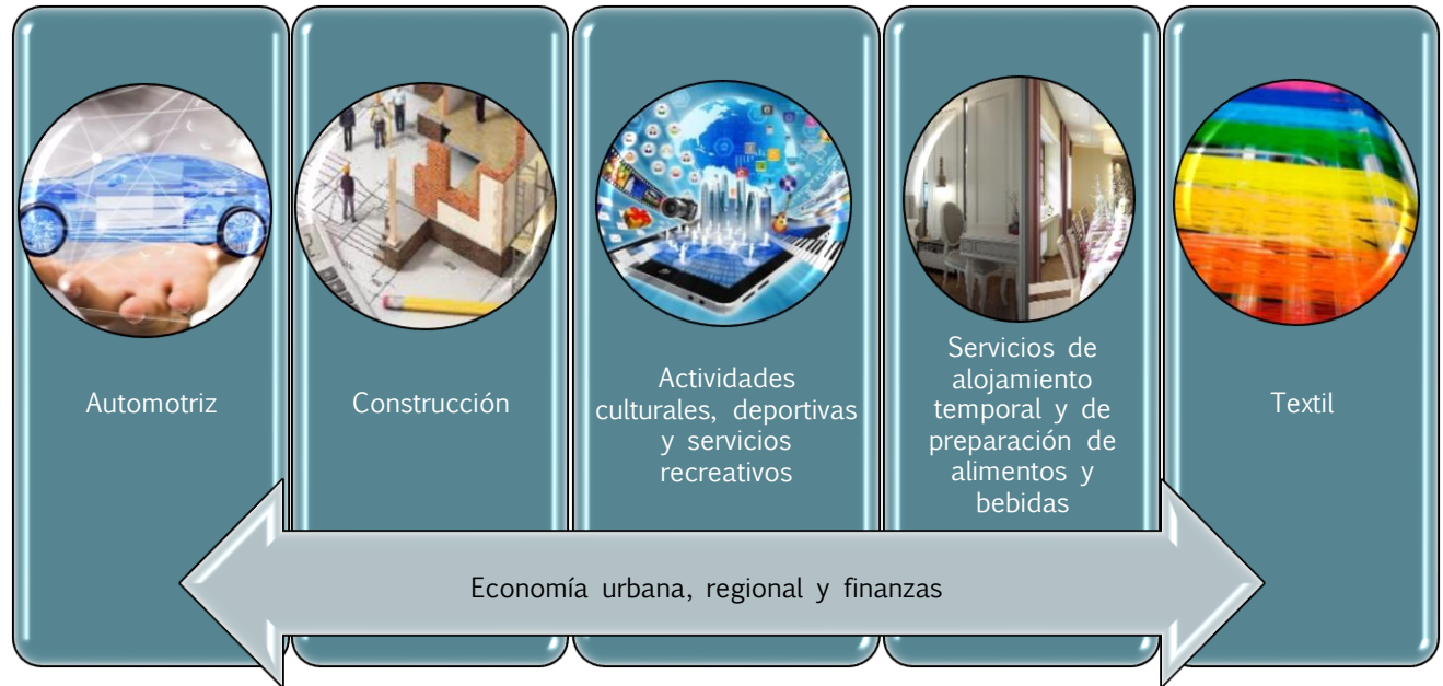
Ilustración 2 Análisis económico de actividades más afectadas por COVID 19

Estos sectores son relevantes para la economía mexicana, debido a que en conjunto participaron con el 11.30% del Producto Interno Bruto nacional (PIB) de 2020. Particularmente, la industria automotriz y textil representan el 20.94% de la industria manufacturera. Mientras que, las actividades de servicios de esparcimiento culturales y deportivos, y otros servicios recreativos, así como los servicios de alojamiento temporal y de preparación de alimentos y bebidas participan con el 2.58% del total de las actividades terciarias.